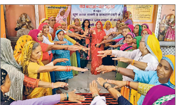
चरखी दादरी। कन्या भूण हत्या रोकने की शपथ लेती महिलाएं।

मिलकर करना होगा। उपस्थित महिलाओं तथा पुरुषों से कन्या भूण हत्या रोकने के लिए शपथ लेने और सभी को जागरूक करते हुए कहा कि बेटियों को शिक्षित और सशक्त बनाने से ही समाज का विकास