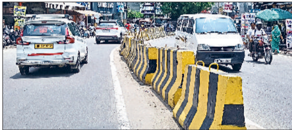
भिवाणी। जिला प्रशासन द्वारा महाराणा प्रताप चौक के निकट सड़क के बीच रखवाए गए सीमेंट के बैरिकेड्स के पास तोड़े गए ग्निल के हिस्से के बीच से निकलते राहगीर, जो हादसे को न्योता दे रहे हैं।