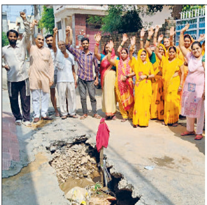
भिवाणी। धंसी गली को लेकर विरोध जताते क्षेत्रवासियों।