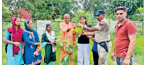
भिवानी। त्रिवेणी पौधरोपित करते पर्यावरण प्रेमी।

उन्होंने कहा कि त्रिवेणी, जिसमें बरगद, पीपल और नीम के पेड़ शामिल होते हैं, को भारतीय संस्कृति में अत्यंत शुभ और पवित्र माना जाता है। इन पौधों का रोपण न