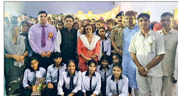
लोहासू। लोहासू के कुडल के राजकीय विद्यालय में कार्यक्रम मौजूद अतिथिगण, स्कूल स्टाफ व विद्यार्थी।