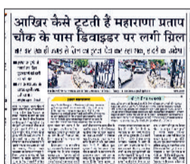
हरिभूमि समाचार पत्र में 20 जून को प्रकाशित खबर।

महाराणा प्रताप चौक के निकट दुकानदारों ने सड़क के दोनों तरफ फुटपाथ पर होर्डिंग व बैनर रखकर कच्चाई कर रखा है। इसके अलावा दुकानदारों द्वारा फुटपाथ के आगे सड़क पर वाहन खड़े कर दिए जाते हैं, जिसकारण राहगीरों को फुटपाथ पर चलने की जगह नहीं मिलती और उन्हें मजबूरीवश सड़क के बीच चलना पड़ता है, जिससे हादसे होने का अंदेश बना रहा है।