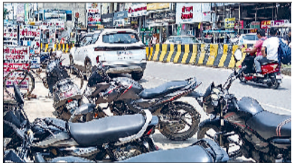
भिवाणी। चौक के निकट दुकानदारों द्वारा होर्डिंग व बैनर रखकर कच्चाई गई फुटपाथ, जिसकारण राहगीर सड़क पर चलते हैं।

महाराणा प्रताप चौक के निकट मोबाइल शॉप के आगे सड़क पर मोड़ है। यहां वाहन तेज गति से निकलते हैं, जिससे हादसा होने का अंदेश बना रहता है। हादसों से बचने के लिए स्पीड ब्रेकर बनाना बहुत जरूरी है।