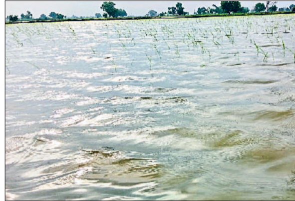
भिवानी। बारिश के जमा पानी से बर्बाद हुई कपास की फसल और बरसात के पानी में डूबी धान की फसल।

बवानीखेड़ा हलके के गांव लोहारी जाट, बवानीखेड़ा, मंडाणा, तिगड़ाना, मिताथल, घुसकानी, धनाना, जताई, बडेसरा के अलावा अनेक गांवों में खरीफ की फसलें तबाह होने की स्थिति में पहुंच गई है।