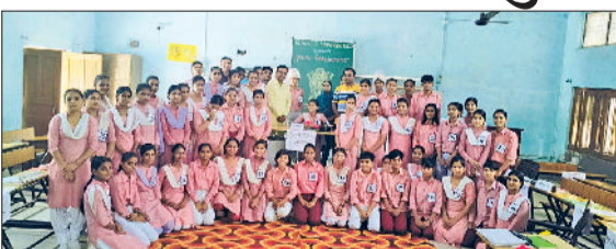
भिवानी। मानहरे के स्कूल में आयोजित युवा संसद में उपस्थित बच्चे व शिक्षक।