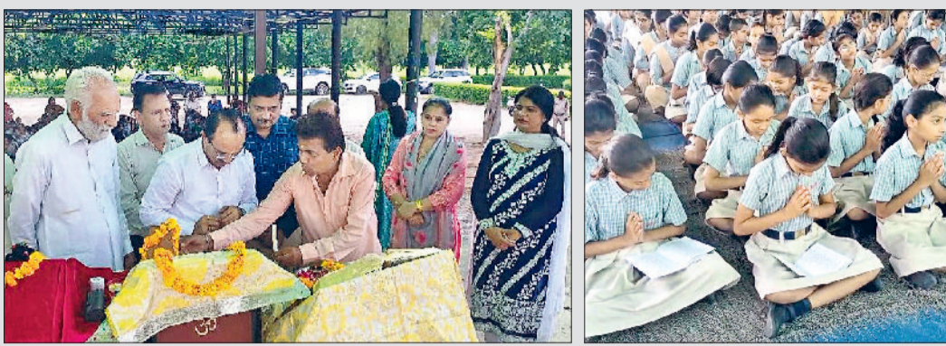
भिवाणी। कार्यक्रम का शुभारंभ करवाते शिक्षा बोर्ड चेयरमैन व प्रार्थना सभा में गीता के श्लोक पढ़ते बच्चे।