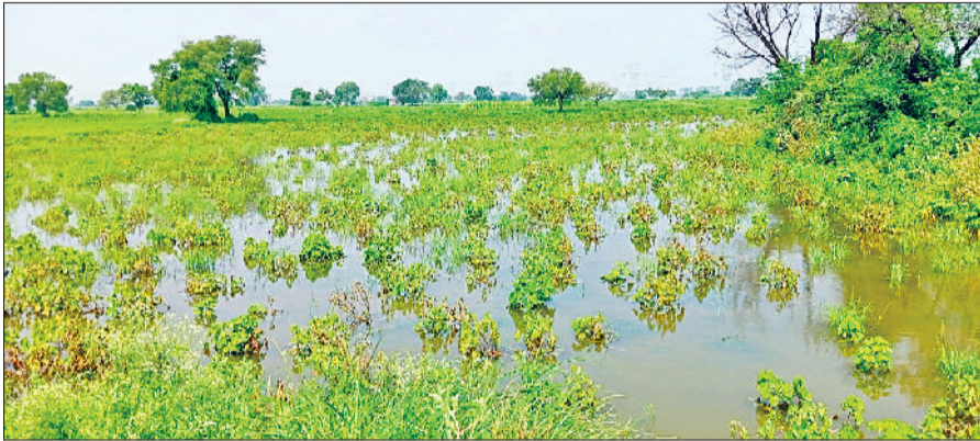
भिवानी। बारिश के जमा पानी से बर्बाद हुई कपास की फसल और बरसात के पानी में डूबी धान की फसल।