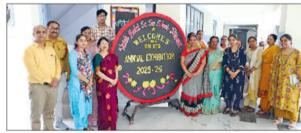
भिवानी। आयोजित कार्यक्रम में उपस्थित शिक्षक व अन्य।

वैश्य मॉडल स्कूल, भिवानी के प्रांगण में विभिन्न शैक्षणिक विषयों में नवाचार एवं कला समन्वयन पर आधारित भव्य प्रदर्शनी का आयोजन किया गया जिसमें पहली कक्षा से 12वीं कक्षा तक के विद्यार्थियों द्वारा ग्रीष्मकालीन गृहकार्य के बतौर बनाए गए चार्टर्स, वर्किंग एवं नॉन- वर्किंग मॉडल्स, प्रोजेक्ट्स, एवं आर्ट एंड क्राफ्ट के तहत बनीं विविध कलाकृतियों का प्रदर्शन किया गया। प्राइमरी विभाग के विद्यार्थियों द्वारा अंग्रेजी, हिंदी, विज्ञान, गणित